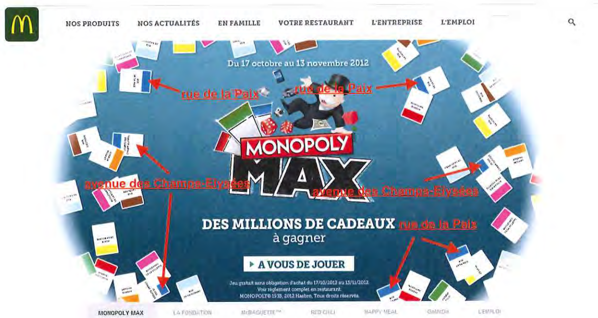
❖ Pièce n°16 : Capture d'écran – Jeu Monopoly

De façon délibérée, la page d'accueil du site internet McDonald's France dans le jeu 2012 reprenant les règles du jeu de 2011 montrait autant de vignettes de la « Rue de la Paix » et « Avenue des Champs-Élysées » - lesquelles seulement permettait de gagner la fameuse dotation de 100 000 euros que celles d'autres rues - et que dès lors il entrait bien dans les intentions de McDonald's de faire croire qu'il y avait autant de vignettes de chaque famille.